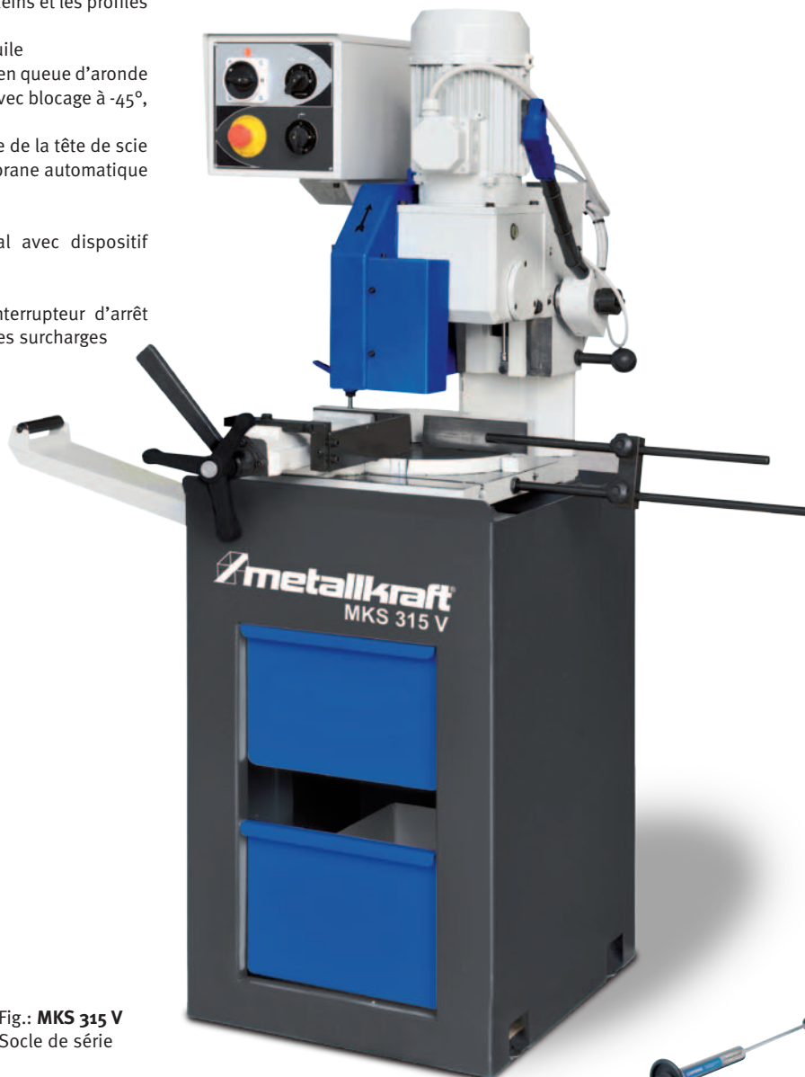
Fig.: MKS 315 V Socle de série