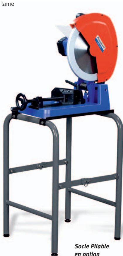
Socle Pliable en option Code article 335 1490 ②