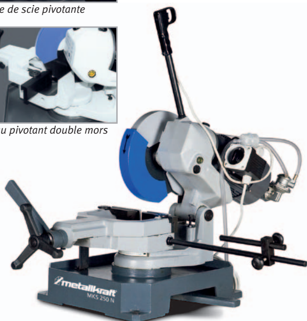
Fig.: MKS 250 N