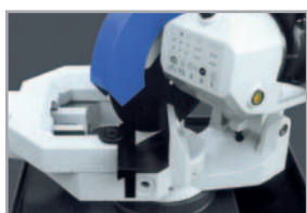
· Tête de scie pivotante