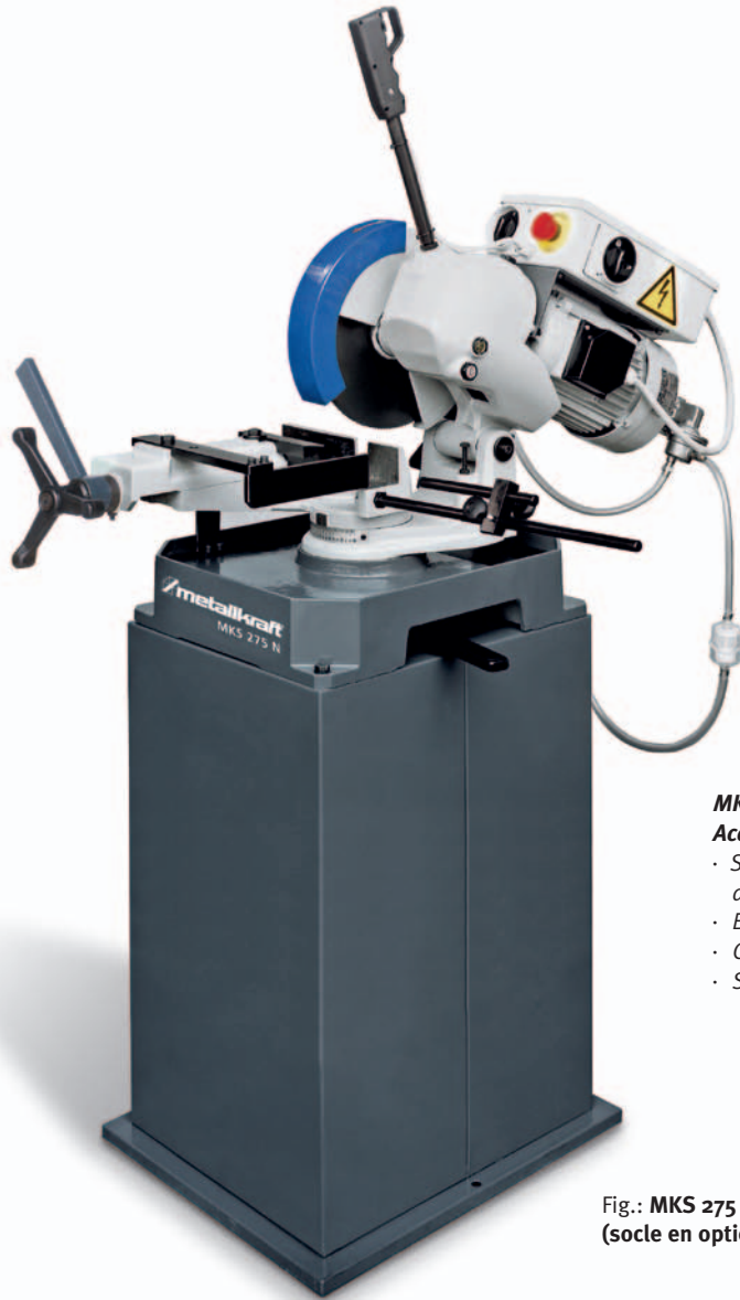
Fig.: MKS 275 N (socle en option)